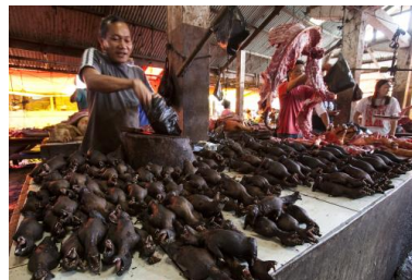
Vente de chauves-souris sur un marché en Indonésie (2014).

teck en Asie... Des cultures destinées au commerce international, et qui sont complètement sorties de leur aire écologique. »