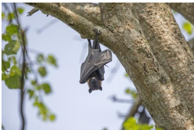
Une chauve-souris en Inde (réserve de Kabini).

En 2002-2003, lors de l'épidémie de Sras (syndrome respiratoire aigu sévère, pneumonie due à un virus de la famille des coronavirus), les marchés d'animaux vivants en Chine ont été des foyers identifiés de contagion. C'est peut-être ce qui s'est passé également en 2019 pour le SARS-CoV-2.