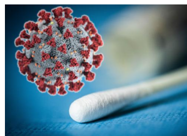
Modélisation du virus Covid-19.

CoV-2 lui permettent de s'accrocher spécifiquement aux cellules humaines, d'où la vulnérabilité de nos organismes face à lui.