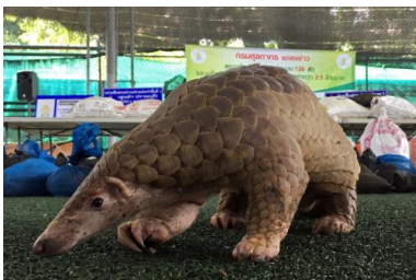
Un pangolin confisqué par les douanes thaïlandaises, en 2017.

« Le problème n'est pas la chauve-souris, le problème est en amont : c'est la destruction des habitats naturels et le non-respect de leur biodiversité », précise de son côté Jean-François Guégan. Et cette cause profonde, on la retrouve d'une épidémie à l'autre : la croissance démographique de la population humaine a entraîné des modifications irréversibles sur les écosystèmes. « La recherche de nouvelles terres agricoles a provoqué ces dernières décennies une déforestation massive qui a bousculé les équilibres naturels , explique ce chercheur en poste à INRAE (Institut national de la recherche pour l'agriculture, l'alimentation et l'environnement), à Montpellier. Les humains se sont retrouvés exposés à des micro-organismes portés par des animaux qu'ils ne rencontraient pas auparavant, ou se sont mis à en consommer d'autres ou à utiliser certaines parties de leur corps comme avec les pangolins. Or c'est lors du passage d'un animal à des humains que ces micro-organismes deviennent pathogènes pour l'homme – plus par circonstances que par nécessité, ainsi que l'exprimait le professeur Charles Nicolle. Ce phénomène remonte au néolithique : chaque fois que l'homme a modifié les sols, a commencé à défricher les écosystèmes pour le développement de son agriculture, il s'est retrouvé exposé à de nouveaux micro-organismes qu'il n'avait jamais rencontrés auparavant. »