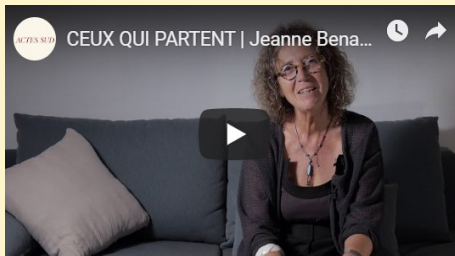
Vidéo de présentation du livre par l'auteure