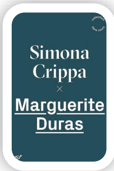
Marguerite Duras Simona Crippa

Démésure, scandale, incantations... C'est la force du mythe qui revit et se renouvelle dans la voix de Marguerite Duras qui, comme le mythologue de la cité, façonne notre mémoire, parle à notre imaginaire, crée et raconte le monde. L'intérêt de cette étude est de parcourir l'œuvre de Marguerite Duras – littérature, cinéma, théâtre, écrits pour les journaux – afin de montrer que l'écrivaine procède sans cesse à la création d'espaces mythiques en renouvelant et modernisant l'univers mythologique. L'effet incantatoire et scandaleux de sa parole, la pratique et les procédés de son écriture, les thèmes et les motifs récurrents de l'œuvre, sont analysés pour la première fois comme autant de manifestations d'un geste qui, par les réseaux profonds de toutes ces relations, a trait à la mythopoétique, c'est-à-dire à la fabrication du mythe. C'est pourquoi la voix de Duras séduit encore lecteurs, chercheurs, écrivains contemporains : la parole du mythe est une force vive qui ne se tarit jamais.